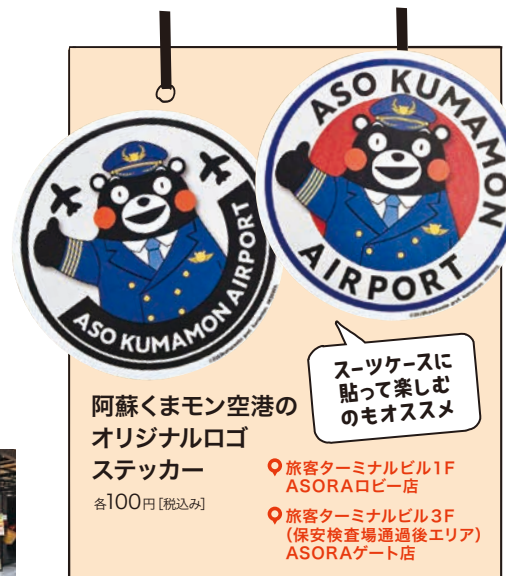
阿蘇くまモン空港の オリジナルロゴ ステッカー