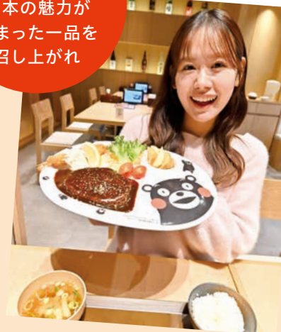
熊本県産あか牛ハンバーグ 〜ブラックデミグラスソース〜 2,000円 [税込み] くまモンをイメージした特製ブラック デミグラスソースが決め手！ くまモンのプレートもキュート。