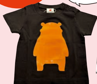
くまモンのTシャツ 3,520円 [税込み]