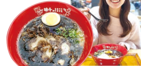
くまもと黒マー油ラーメン 1,080円 [税込み]