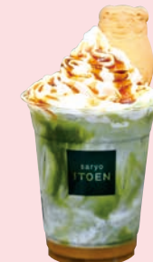
大阿蘇牛乳使用 黒みつきなご抹茶ラテ 990円 [税込み]