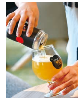
くまモンのクラフトビール 1,150円 [税込み]