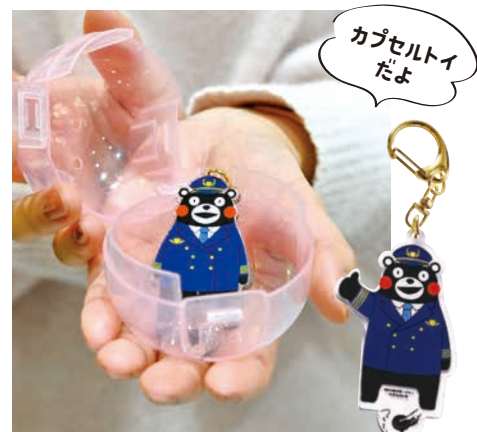
くまモンのキーホルダー (全5種) 各400円 [税込み]