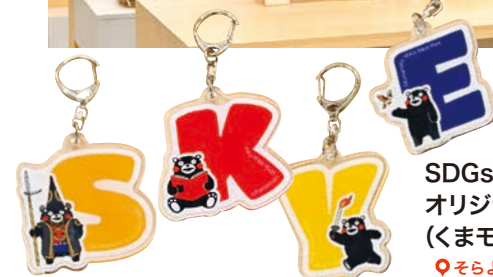
SDGsパーク オリジナルキーホルダー (くまモン) 700円 [税込み]