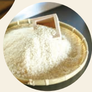
碾米後4天內炊成的 米飯,香氣、美味與 甜味上層樓▶