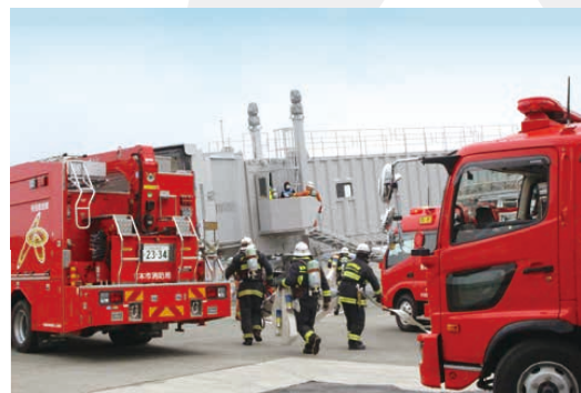
※防火防災訓練（2024年3月）

汲取熊本地震的教訓，建築採用能抵禦短時間頻繁震動之大地震的結構。電力能從複數系統送電，還設有可運行72小時的備用發電機以備不時之需。同時實施設想航廈大樓發生火災時的防火防災訓練等，不斷致力於維護「安全、安心」的舉措。