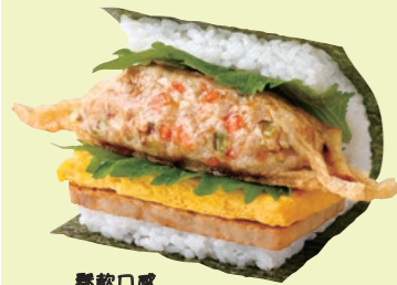
鬆軟口感 小朋友也喜歡 850日圓(含稅)

使用自江戶時代傳承至今的熊本縣南關町名產「南關豆皮」，打造出創意十足的 Po-tama。