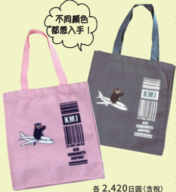
不同顏色 都想入手