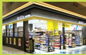
旅客航廈大樓 1樓 國際航線抵達口旁 Open / 7:00~21:00

於 2025 年 11 月新開幕的藥妝店。在「讓美麗與健康更開心、更貼近生活」的理念下，網羅各式藥品、化妝品與醫療用品等。同時也提供豐富多樣的自家品牌商品。