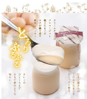
フロマージュプリン