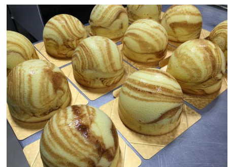
キャラメルおっぱいチーズケーキ