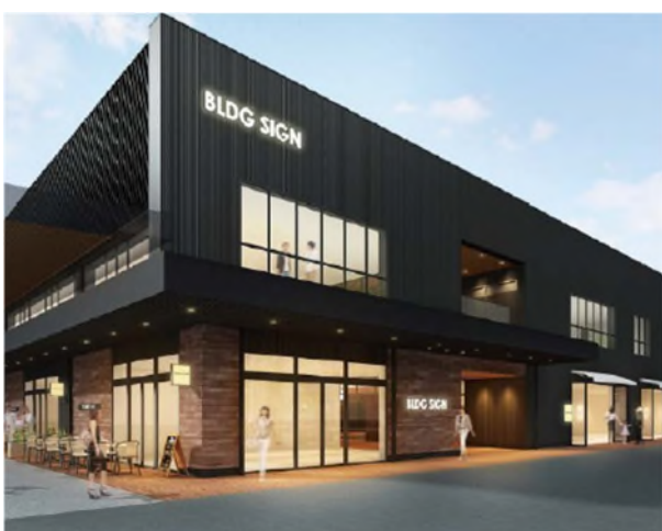
<商業棟エリア外観イメージ>