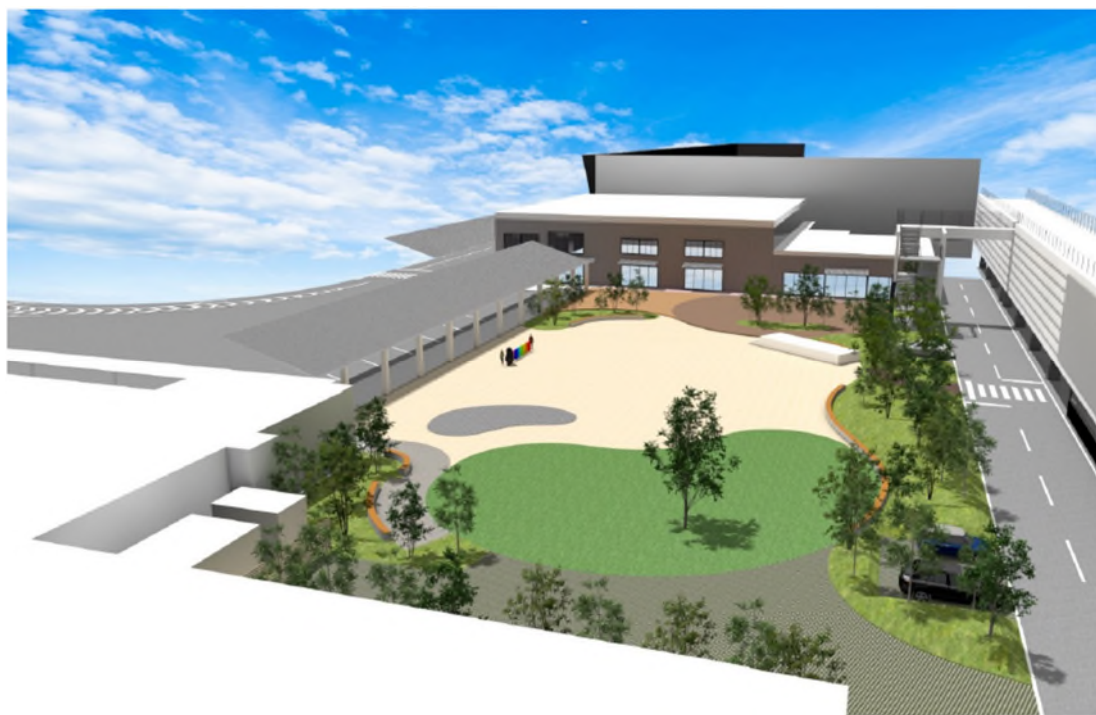
<にぎわい広場イメージ>

ターミナルビル建替え中の仮設ターミナルビルをリノベーションし運用を予定している「観光交流エリア（別棟ビル）」では、空港から出発する熊本・九州圏観光がより便利になるサービスなどを誘致し、旅客利便性の向上を目指してまいります。