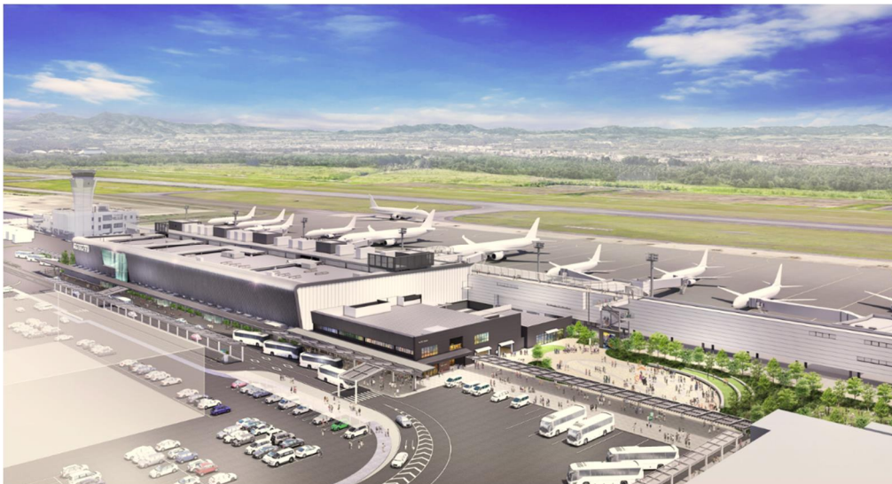
< 2 期エリア開業後の全体イメージ >

また、2 期エリアを今後も地域や旅客の皆様にも愛される施設へと発展させていくため、空港で働く職員や空港をご利用いただく皆様を対象に名称募集・投票を実施し、この度「そらよか」に決定いたしましたので、発表させていただきます。