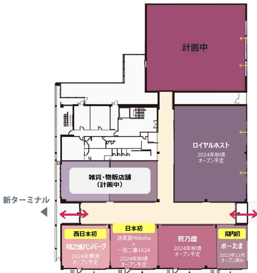
<そらよかダイニング フロアマップ>

新大空港構想に掲げる「観光客・ビジネス利用者の双方が利用しやすい空港」、「空港を訪れる全ての人を楽しむことができる空港」の実現に向け、県内外の幅広い年齢層の方々それぞれに合ったお店を見つけていただけるラインナップとなっております。